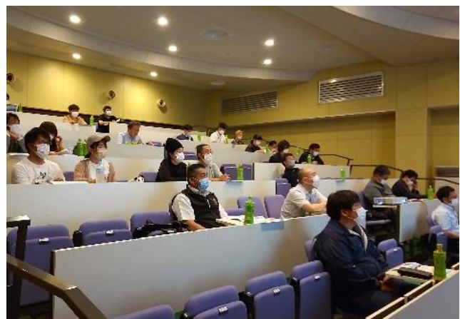
講演に聞き入る生産者、JA関係者