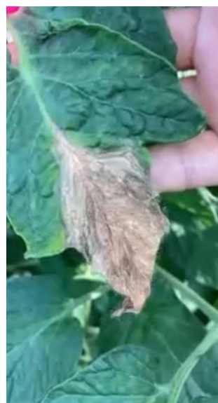
スマートフォンによるトマトの画像