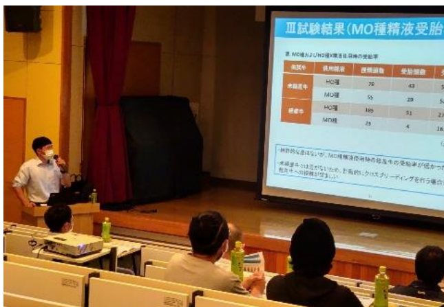
研究成果を説明する訓子府実証農場

セミナーでは、先行して試験を進めているホクレン訓子府実証農場が「クロスブリーディングの取り組み状況」をテーマに講演。F1牛、3元牛の乳量、乳質、安産性、受胎率など、クロスブリーディングに取り組む生産者に大変参考になる内容が紹介され、講演後には多数の質問が寄せられるなど、大盛況のセミナーとなりました。