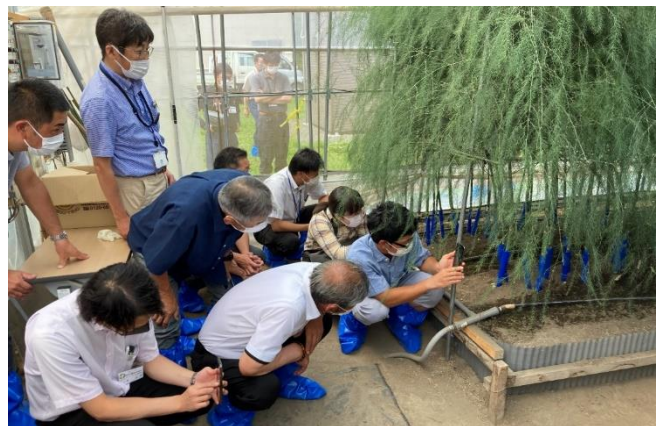
農場ハウスで自動収穫ロボットデモを視察する参加者