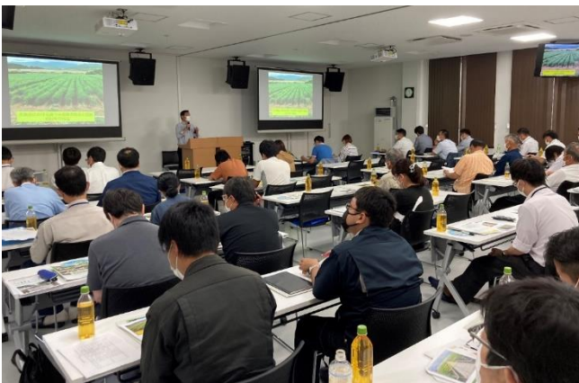
セミナーでの講演の様子

なお、当日の概要や資料などのお問い合わせは、農産技術課（Tel0157-47-2130）や、各支所営農支援室までお願いします。