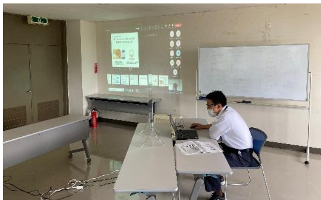
「不適切な減肥が草地の植生に及ぼす影響」について説明する営農支援室