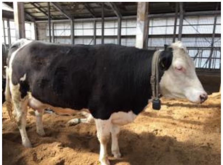
ホルスタイン種とモンベリアード種の交配種 (2018年5月出生)