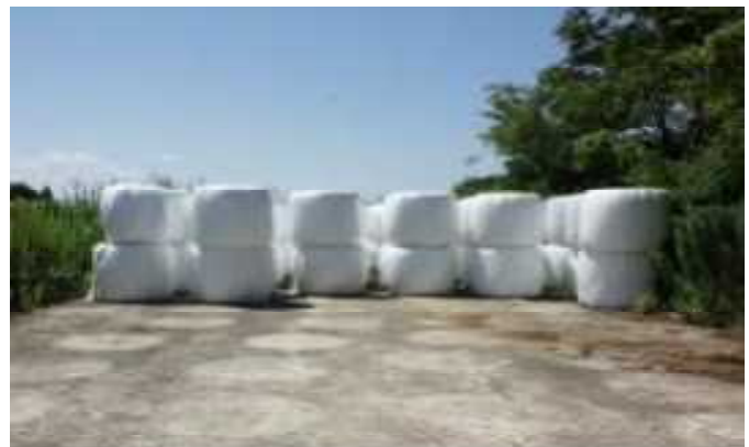
写真2 ロールベールの縦積み保管、越冬前に破損の点検を