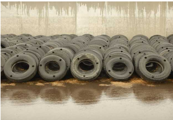
写真1 整理整頓されたサイロ周辺のタイヤ