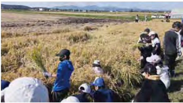
滝川西小・第一小 稲刈り体験