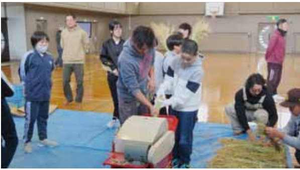
上芦別小 脱穀体験