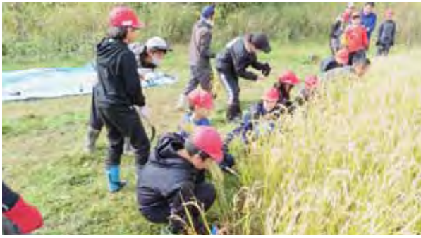
上芦別小 稲刈り体験