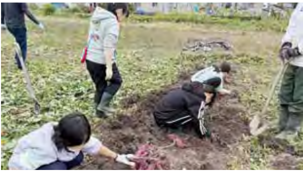
江部乙小 さつまいも収穫