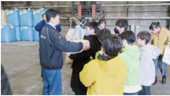
上芦別小 米施設見学