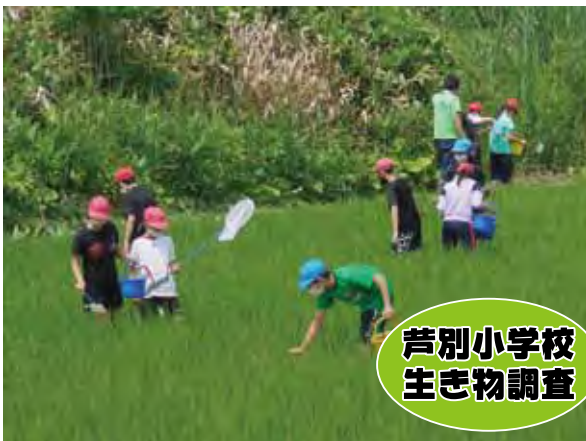
芦別小学校 生き物調査