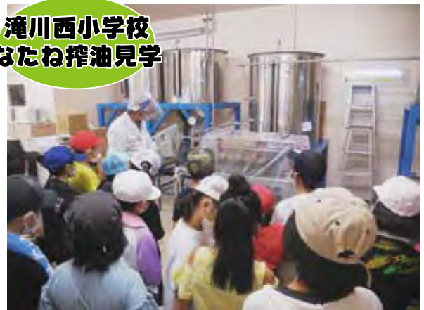
滝川西小学校 なたね搾油見学