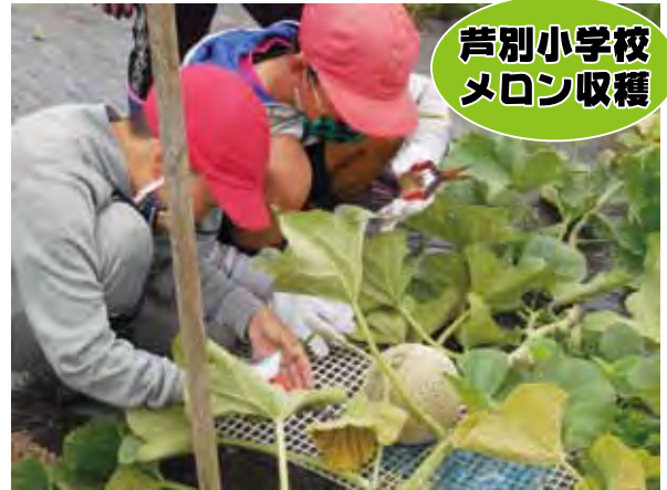
芦別小学校 メロン収穫