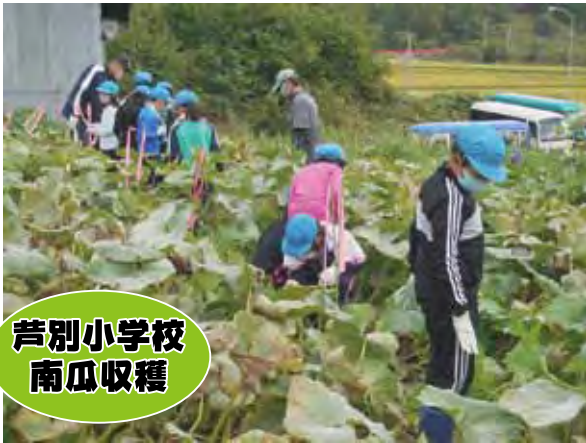
芦別小学校 南瓜収穫